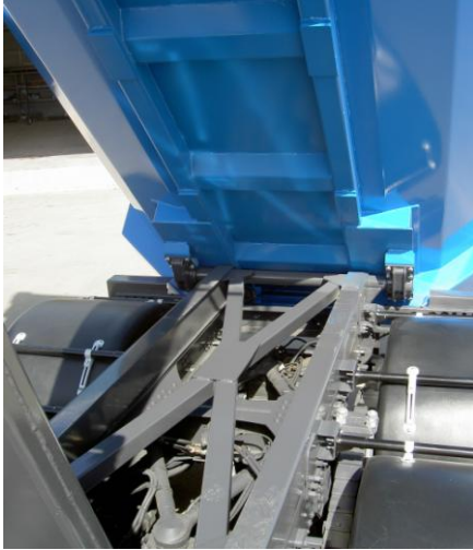
Refuerzo sobrebastidor con Cruz de San Andrés