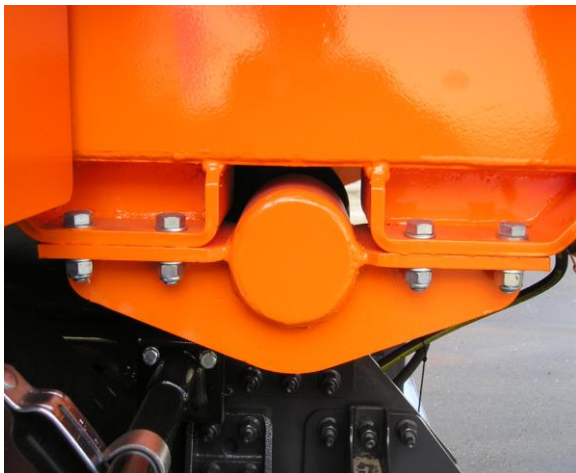
Detalle bulón eje de giro \varnothing=90 mm