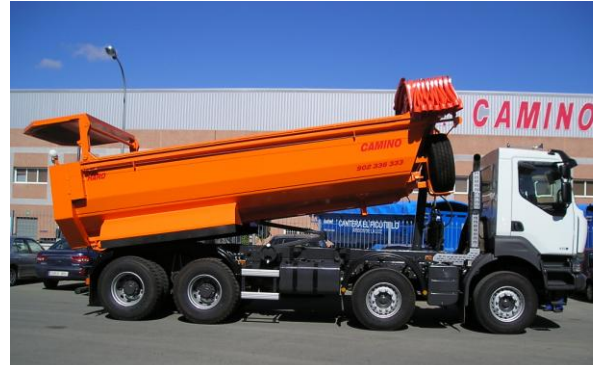
Detalle apertura hidráulica