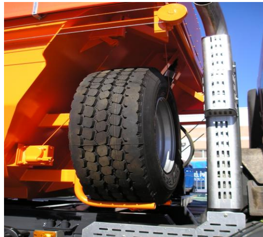
Detalle soporte de neumático de repuesto

Nota: la empresa se reserva el derecho a modificar cualquier dato técnico de esta información sin previo aviso