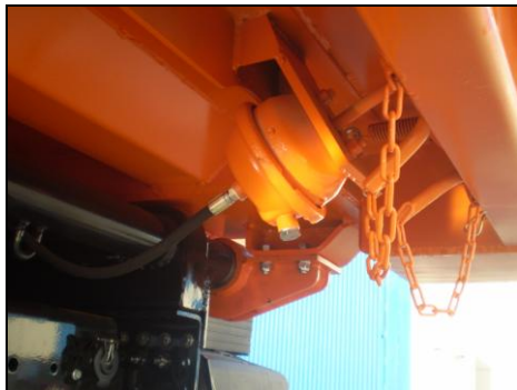
Apertura neumática de puerta