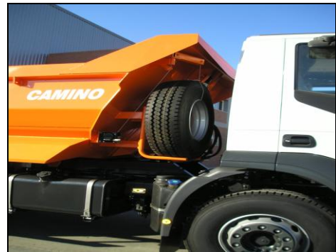
Detalle soporte de neumático de repuesto

Nota: la empresa se reserva el derecho a modificar cualquier dato técnico de esta información sin previo aviso