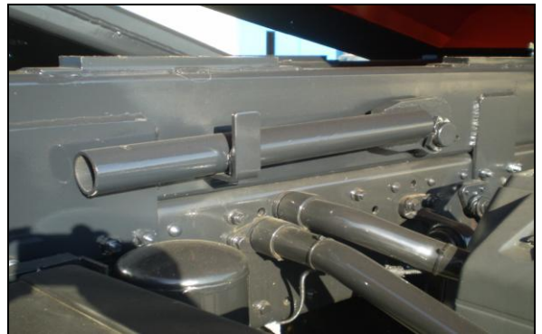
Tentemozo para operaciones de mantenimiento