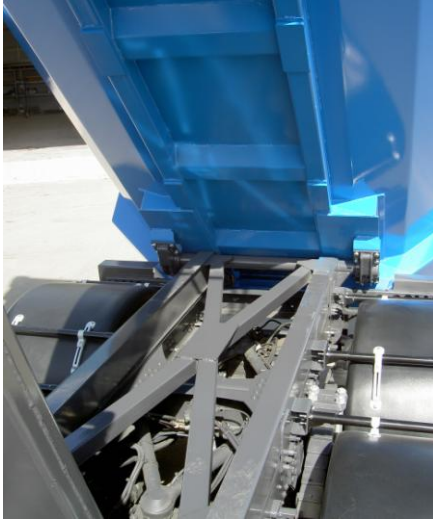
Refuerzo sobrestador con Cruz de San Andrés