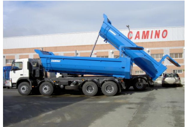
Detalle apertura hidráulica