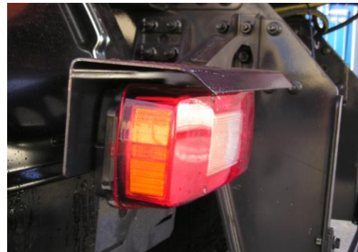
Detalle protector de piloto trasero

Nota: la empresa se reserva el derecho a modificar cualquier dato técnico de esta información sin previo aviso