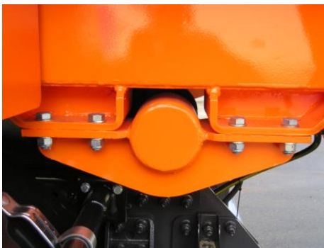
Detalle bulón eje de giro Ø=90 mm.